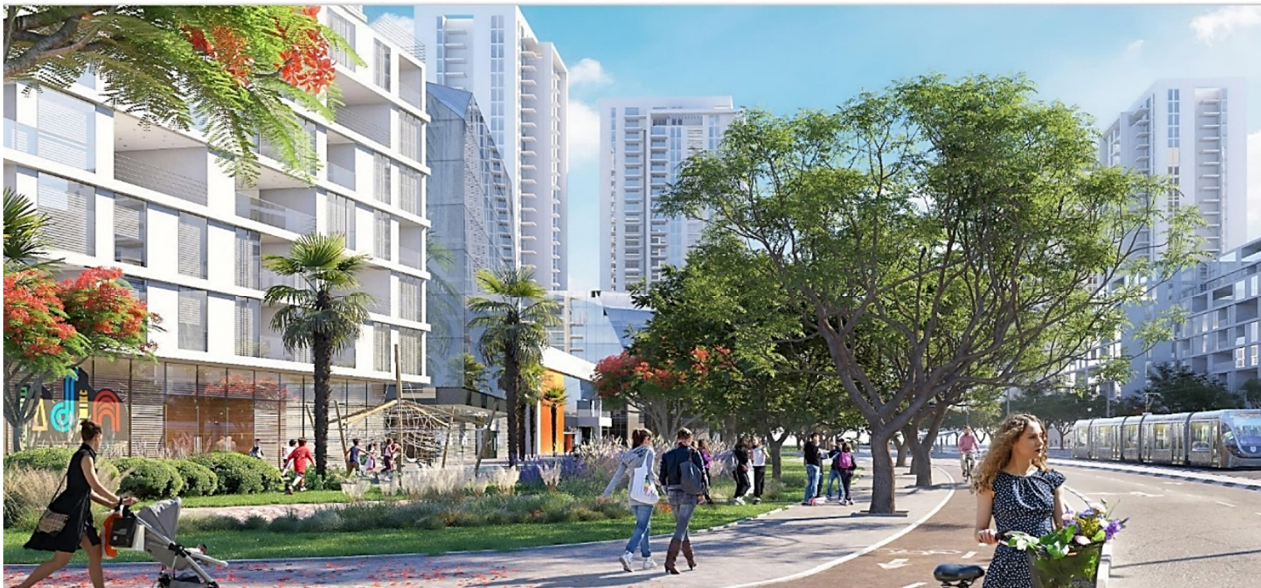
התמונה להדמיה בלבד – אלונים גורביץ' אדריכלים ובוני ערים