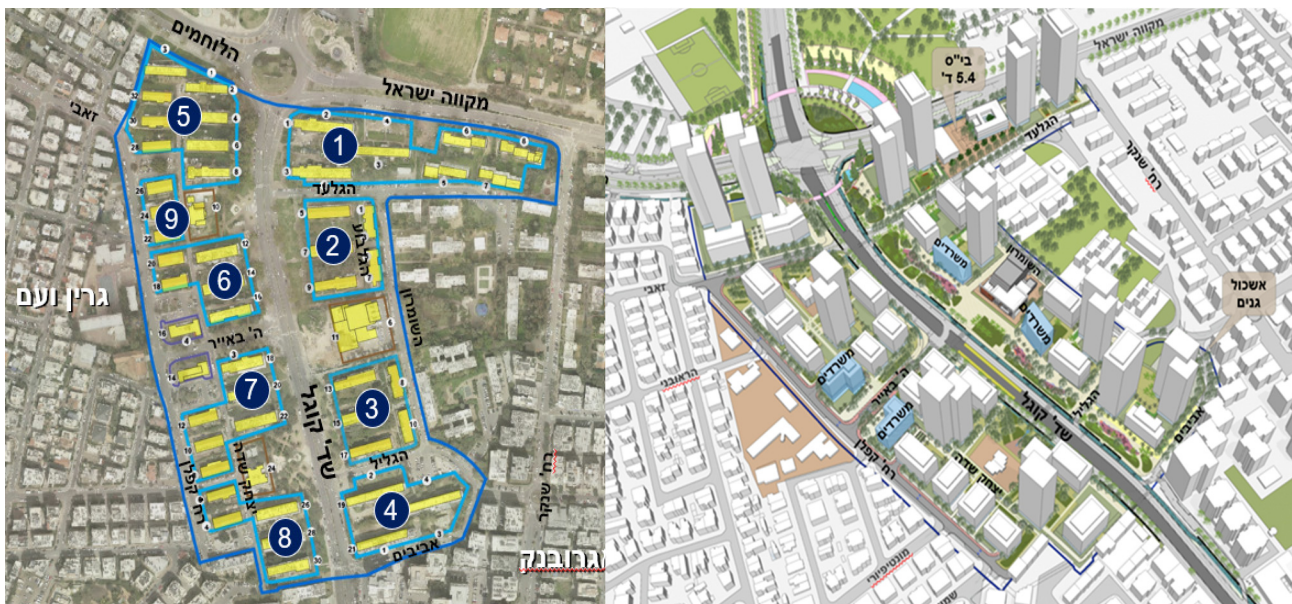
התמונה להדמיה בלבד – אלונים גורביץ' אדריכלים ובוני ערים