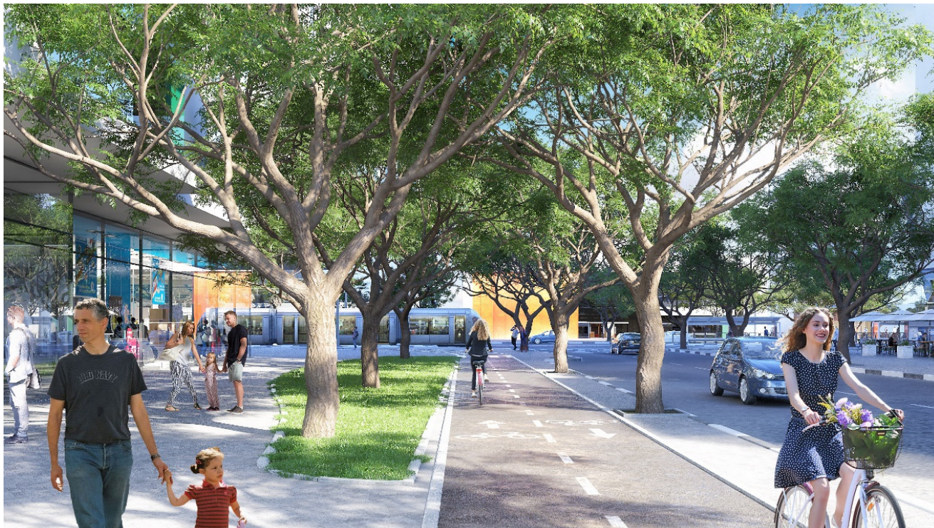
התמונה להדמיה בלבד – אלונים גורביץ' אדריכלים ובוני ערים