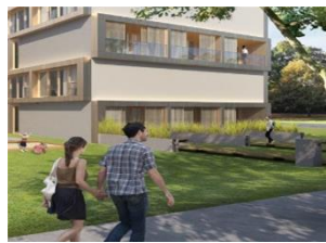
שמירה על מרקם שכונתי