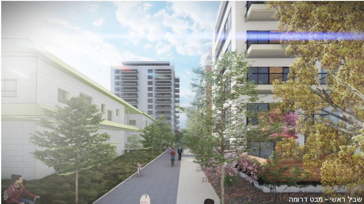
התמונה להדמיה בלבד. משרד אדריכלים גשן