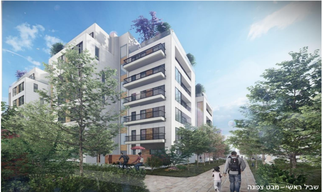
שביל ראשי - מבט צפונה התמונה להדמיה בלבד. משרד אדריכלים גשן

במעמד זה, נשמח לאחל שנה טובה ומתוקה. שנה מלאה בהתחדשות, עשייה, בריאות ושמחה. שנדע לייצר שיתופי פעולה פוריים ומלאים, ונלמד לגשר על הפערים "תַכְלָה שָׁנָה וְקַלְלוּתֶיהָ, תַחַל שָׁנָה וּבְרֻכּוֹתֶיהָ"