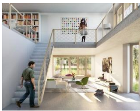
יצירת דירות מיוחדות לתושבי השכונה