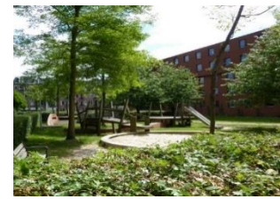
מרחב ציבורי מזמין להולכי רגל