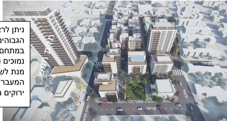
התמונה להדמיה בלבד. משרד אדריכלים גשן

ניתן לראות בהדמיה כי שני הבניינים הגבוהים נמצאים בשולי המתחם, וכי במתחם עצמו מתוכננים מבנים נמוכים ( ממוצע של 6.5 קומות). על מנת לשמור על אופי השכונה תוכננו המעברים בין הבניינים עם שבילים ירוקים מלאים בצמחיה.