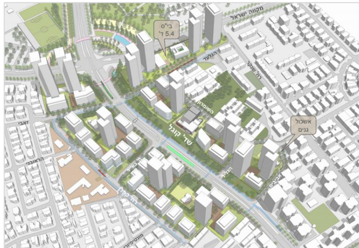
הדמיה: תפיסת הבינוי התחדשות שדרות קוגל

אנו שמחים לעדכנכם כי התוכנית הוגשה ללשכת התכנון (מחוז מרכז) בחודש פברואר 2022 ונמצאת בהליכים של קליטה, על מנת לקבוע דיון בתוכנית בוועדה המחוזית תל אביב. טרם הדיון בוועדה המחוזית נקיים כנס שיתוף ציבור בו נציג בפניכם את התכנון המעודכן ונסביר את לוחות הזמנים.