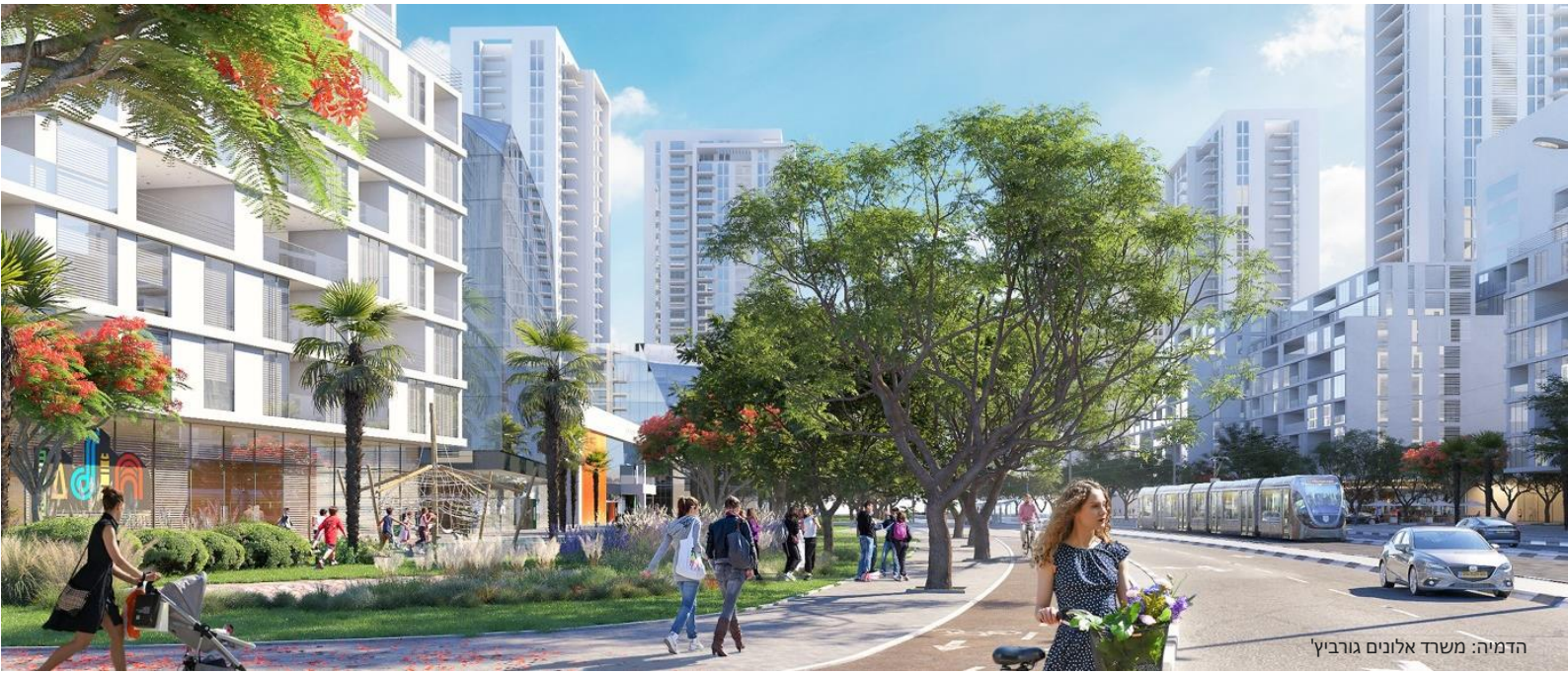
הדמיה: משרד אלונים גורביץ'